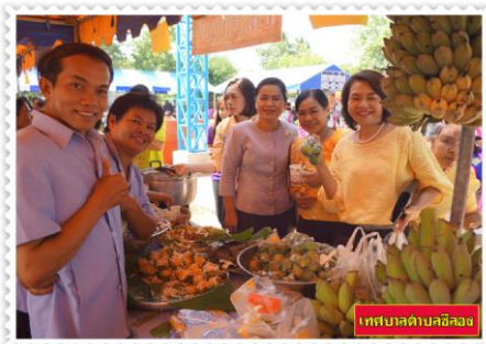
เทศบาลตำบลฉะเชิงเทรา