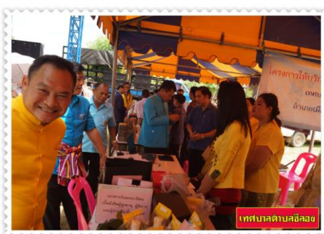
เทศบาลตำบลฉะเชิงเทรา