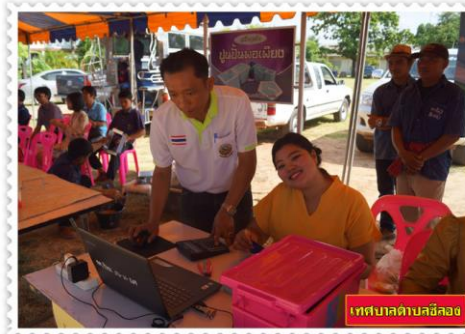
เทศบาลตำบลฉะเชิงเทรา